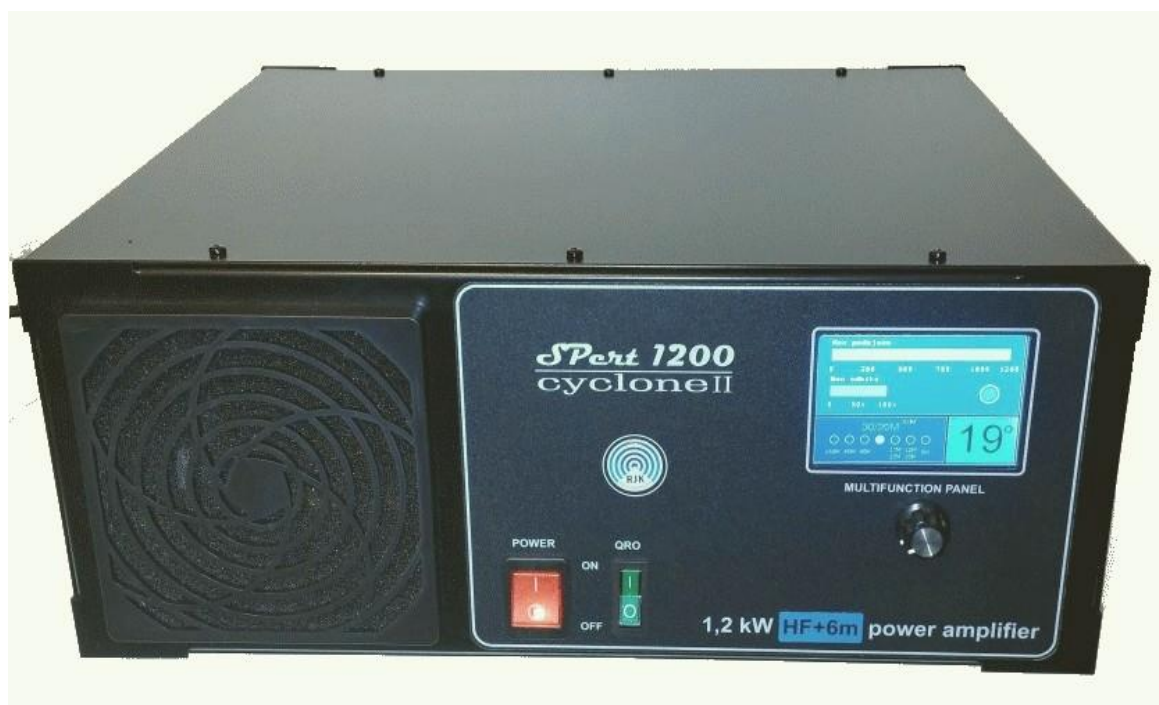
Wzmacniacz Spert 1200 Cyclone II , widok z przodu