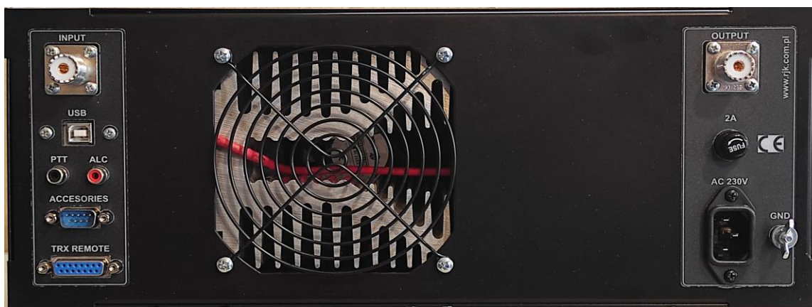
Wzmacniacz Spert 1000 / Wzmacniacz Spert 1200 Cyclone II, widok z tyłu

Wzmacniacze tranzystorowe „Spert 1000”/„Spert 1200 CYCLONE II” to wzmacniacze liniowe przeznaczone do pracy w amatorskich systemach radiokomunikacyjnych, na wszystkich pasmach KF, wszystkimi emisjami, w zakresie od 1,8 do 30 MHz oraz 50 MHz. Zastosowane jest w nim standardowe chłodzenie w postaci aluminiowego radiatora przedmuchiwanego wentylatorem 120x120 mm lub (w niektórych wersjach) chłodzenie z wykorzystaniem cieplowodów.