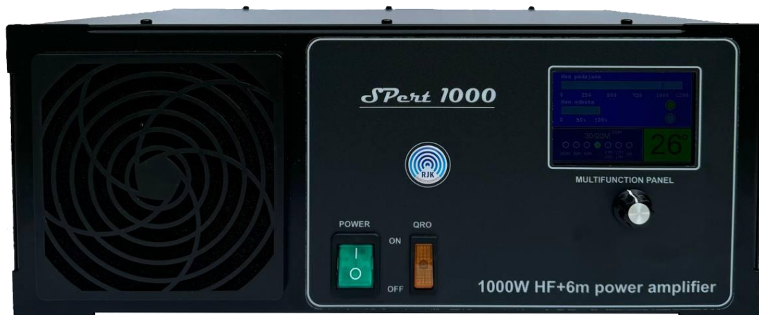
Wzmacniacz Spert 1000, widok z przodu